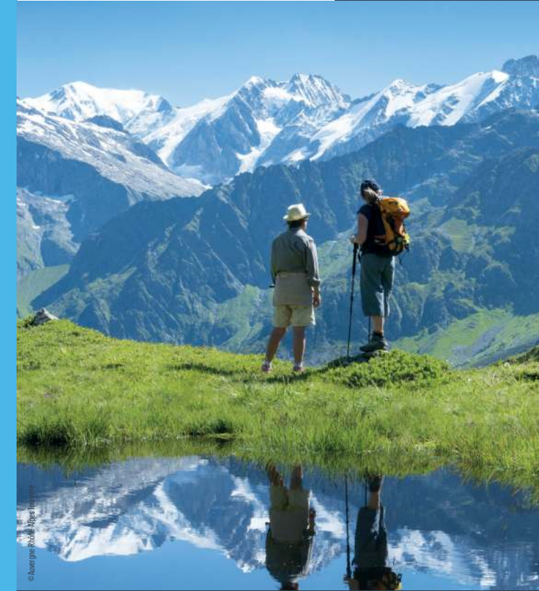
Les Cars de la Région Auvergne-Rhône-Alpes

Attention Les horaires sont susceptibles d'être modifiés, pensez à vérifier les informations avant votre voyage. Les horaires sont accessibles dans la limite des places disponibles. Pensez à anticiper votre achat de billets.